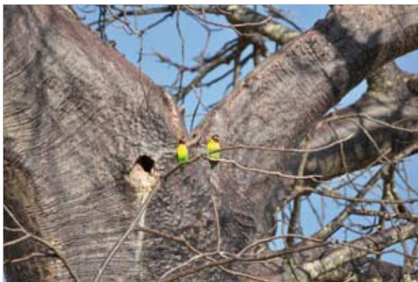
Lovebirds (Tansania) - die Unzertrennlichen - verbringen ihr Leben lang die Zeit zu zweit ...

Termin: Sa, 17.09.2016, 19.30 h Ort: Kath. Pfarrheim St. Joseph Hackhauser Str. 16, Solingen-Ohligs Kosten: Eintritt frei – Spenden erbeten